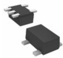
DMA502010R Panasonic Electronic Components TRANS 2PNP 50V 0.1A SMINI5