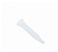
RDBD-MEKURAPIN Hirose CONN CONTACT PIN