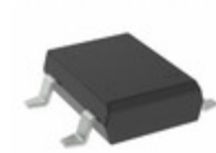
RDBLS207G C1G TSC (Taiwan Semiconductor) BRIDGE RECT 1PHASE 1KV 2A DBLS