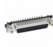
RDBD-25SE-LNA(55) Hirose Electric Co Ltd CONN 25POS FEMALE