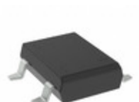
RDBLS207G RDG TSC (Taiwan Semiconductor) BRIDGE RECT 1PHASE 1KV 2A DBLS