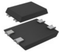
RDBF1510U-13 Diodes Incorporated BRIDGE RECTIFIER DBF