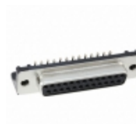
RDBD-25SE1/M2.6(55) Hirose Electric Co Ltd CONN 25POS FEMALE