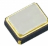
TG-5035CJ-26N 26.0000MB Epson OSC VCTCXO 26MHZ SMD