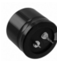
ECO-S2GP151DA Panasonic Electronic Components CAP ALUM 150UF 20% 400V SNAP