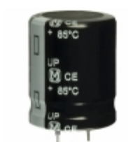
ECO-S2GP121CA Panasonic Electronic Components CAP ALUM 120UF 20% 400V SNAP