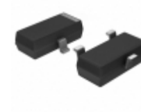
BCX71K Fairchild/ON Semiconductor TRANS PNP 45V 0.5A SOT-23