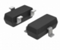
BCX71JLT1G ON Semiconductor TRANS PNP 45V 0.1A SOT-23