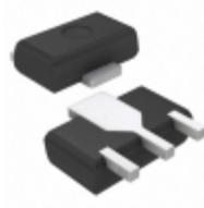
DSA7003S0L Panasonic TRANS PNP 50V 1A MINIP3