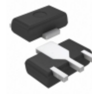
DSA7003R0L Panasonic TRANS PNP 50V 1A MINIP3