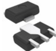
DSA7003R0L PanaVise TRANS PNP 50V 1A MINIP3