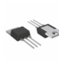
L2006L5 Littelfuse Inc. TRIAC SENS GATE 200V 6A TO220