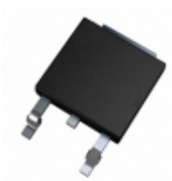
L2006D8RP Littelfuse Inc. TRIAC SENS GATE 200V 6A TO252