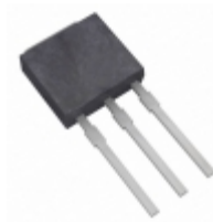
L2006V5TP Littelfuse Inc. TRIAC SENS GATE 200V 6A TO251