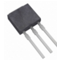
L2006V5 Littelfuse Inc. TRIAC SENS GATE 200V 6A TO251