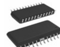
A3973SLB-T Allegro MicroSystems, LLC IC MOTOR DRIVER SER 24SOIC