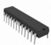
A3973SB-T Allegro MicroSystems, LLC IC MOTOR DRIVER SER 24DIP