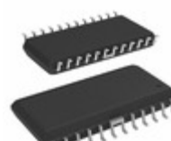
A3973SLBTR-T Allegro MicroSystems, LLC IC MOTOR DRIVER SER 24SOIC