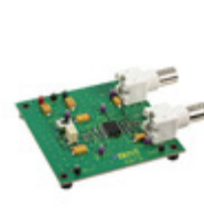
AD637-EVALZ ADI (Analog Devices, Inc.) BOARD EVALUATION FOR AD637