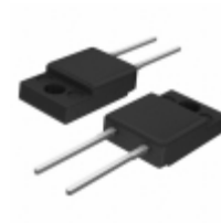
SDURF520 SMC Diode Solutions DIODE GEN PURP 200V ITO220AC