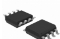
11LC040T-E/SN Microchip Technology IC EEPROM 4KBIT 100KHZ 8SOIC