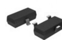
11LC040T-I/TT Microchip Technology IC EEPROM 4KBIT 100KHZ SOT23-3