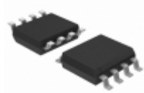
11LC080-E/SN Microchip Technology IC EEPROM 8KBIT 100KHZ 8SOIC