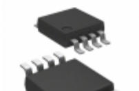
11LC080-E/MS Microchip Technology IC EEPROM 8KBIT 100KHZ 8MSOP