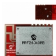
MRF24J40MB-I/RM Microchip Technology RF TXRX MOD 802.15.4 TRACE ANT