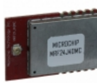
MRF24J40MC-I/RM Microchip Technology RF TXRX MODULE 802.15.4 U.FL ANT