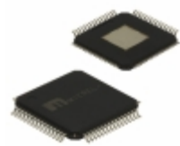
SY89532LHZ-TR Microchip Technology IC SYNTHESIZR LVPECL/LVDS 64TQFP