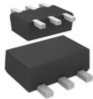
DMC564020R Panasonic Electronic Components TRANS 2NPN PREBIAS 0.15W SMINI6