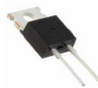
DSEP8-03A IXYS DIODE GEN PURP 300V 10A TO220AC