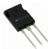
DSEP60-12AR IXYS DIODE GEN 1.2KV 60A ISOPLUS247