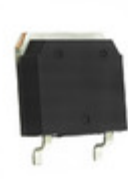
DSEP60-06AT IXYS DIODE GEN PURP 600V 60A TO268AA