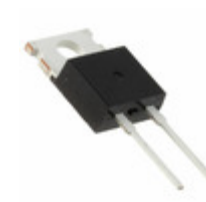
DSEP8-02A IXYS DIODE GEN PURP 200V 8A TO220AC