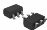
MCP1640BT-I/CHY Microchip Technology IC REG BST ADJ 0.35A SYNC SOT23