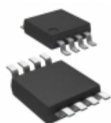
MCP1632T-AAE/MS Microchip Technology IC REG CTRLR MULT TOPOLOGY 8MSOP