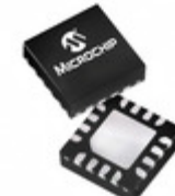
MCP16323T-500E/NG Microchip Technology IC REG BUCK 5V 3A SYNC 16- VQFN