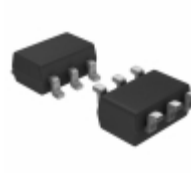
MCP16331T-E/CH Microchip Technology IC REG BUCK ADJ 0.5A SOT23-6