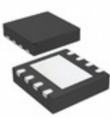
MCP1632T-BAE/MC Microchip Technology IC REG CTRLR MULT TOPOLOGY 8DFN