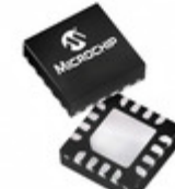
MCP16323T-ADJE/NG Microchip Technology IC REG BUCK ADJ 3A SYNC 16- VQFN