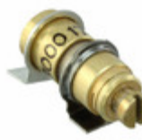
V9000 Knowles Voltronics CAP TRIMMER 1-12PF 2000V SMD