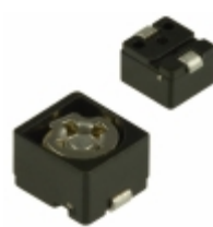
TZB4R500AB10R00 Murata Electronics North America CAP TRIMMER 7-50PF 50V SMD