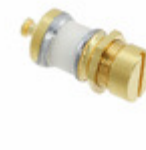
SGNMA3T10002 Sprague Goodman CAP TRIMMER 1-10PF 1000V PNL MNT