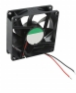
EB50101S2-000U-999 Sunon FAN AXIAL 50X10MM 12VDC WIRE