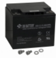
EB50-12-I2 B B Battery BATTERY LEAD ACID 12V 50AH