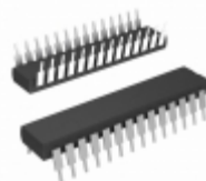
PIC18LC252-I/SP Microchip Technology IC MCU 8BIT 32KB OTP 28SDIP