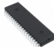
PIC18LC442-I/P Microchip Technology IC MCU 8BIT 16KB OTP 40DIP