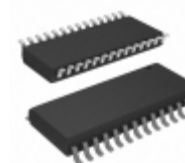
PIC18LC242-I/SO Microchip Technology IC MCU 8BIT 16KB OTP 28SOIC