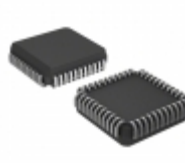
PIC18LC442-I/L Microchip Technology IC MCU 8BIT 16KB OTP 44PLCC