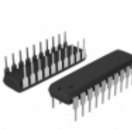
PIC24FJ32MC101-E/P Microchip Technology IC MCU 16BIT 32KB FLASH 20DIP