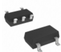
74AHCT1G86W5-7 Diodes Incorporated IC GATE XOR 1CH 2-INP SOT-25