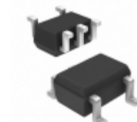
74AHCT1G86SE-7 Diodes Incorporated IC GATE XOR 1CH 2-INP SOT-353