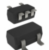
74AHCT1G86GW-Q100, Nexperia USA Inc. IC GATE XOR 1CH 2-INP 5-TSSOP