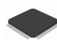
ML9473TBZ03A Rohm Semiconductor IC LCD DRIVER MATRIX 80TQFP