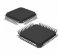
ML9477TBZAMX Rohm Semiconductor IC LCD DRIVER MATRIX 48QFP