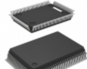
ML9470-12GAZ0AA Rohm Semiconductor IC LCD DRIVER MATRIX 100QFP