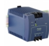
ML95.100 PULS DIN RAIL PWR SUPPLY 95W 24 3.9A