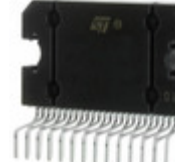
L5958SM STMicroelectronics IC VREG MULTIFUNCT FLEXIWATT27