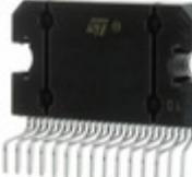
L5958SMTR STMicroelectronics IC VREG MULTIFUNCT FLEXIWATT27