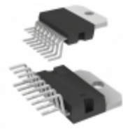
L5956 STMicroelectronics IC VREG MULTIFUNCT MULTIWATT15