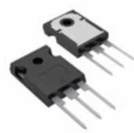
STW30N20 STMicroelectronics MOSFET N-CH 200V 30A TO-247