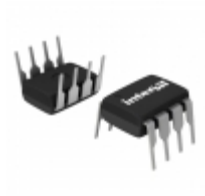
ISL8487IP Intersil IC TXRX RS485/422 5V ESD 8-DIP