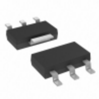
MCP1825S-3302E/DB Microchip Technology IC REG LDO 3.3V 0.5A SOT223-3