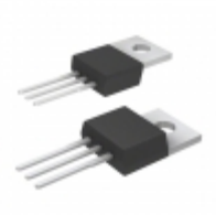
MCP1825S-3002E/AB Microchip Technology IC REG LDO 3V 0.5A TO220-3