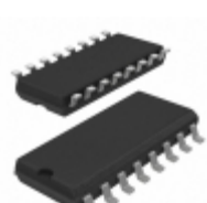
MC10H161MG ON Semiconductor IC DECODER BIN 1:8 16-SOEIAJ