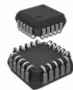
MC10H162FNR2G ON Semiconductor IC DECODER BIN 1:8 20-PLCC