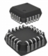
MC10H162FN ON Semiconductor IC DECODER BIN 1:8 20-PLCC