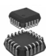
MC10H162FNR2 ON Semiconductor IC DECODER BIN 1:8 20-PLCC