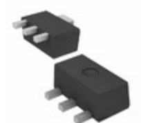
AP2138R-3.3TRG1 Diodes Incorporated IC REG LDO 3.3V 0.25A SOT89