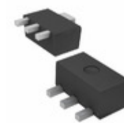
AP2138R-1.2TRG1 Diodes Incorporated IC REG LDO 1.2V 0.25A SOT89