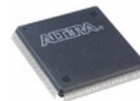
EPF10K50SQC240-1 Altera IC FPGA 189 I/O 240QFP