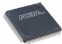
EPF10K50SQC208-3 Altera IC FPGA 147 I/O 208QFP