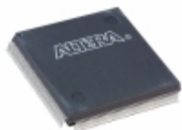
EPF10K50SQC208-3N Altera IC FPGA 147 I/O 208QFP