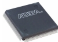
EPF10K50SQC208-2X Altera IC FPGA 147 I/O 208QFP