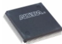
EPF10K50SQC208-1X Altera IC FPGA 147 I/O 208QFP