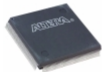
EPF10K50SQC208-1N Altera IC FPGA 147 I/O 208QFP