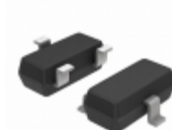
BCX71JLT1G ON Semiconductor TRANS PNP 45V 0.1A SOT-23