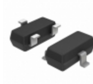
BCX71JLT1 ON Semiconductor TRANS PNP 45V 0.1A SOT-23