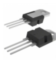
MIC2937A-12BT Microchip Technology IC REG LDO 12V 0.75A TO220-3