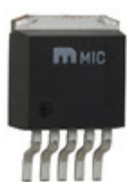
MIC29372BU Microchip Technology IC REG LDO ADJ 0.75A TO263-5