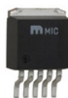
MIC29372WU Microchip Technology IC REG LDO ADJ 0.75A TO263-5