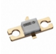
CGH55015F2 Cree/Wolfspeed FET RF 84V 5.65GHZ 440166