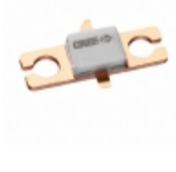
CGH55030F2 Cree/Wolfspeed FET RF 84V 6GHZ 440166