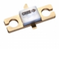
CGH55015F1 Cree/Wolfspeed FET RF 84V 5.8GHZ 440166