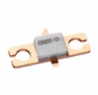
CGH55030F2 Cree Wolfspeed RF MOSFET HEMT 28V 440166