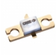
CGH55015F1 Cree Wolfspeed RF MOSFET HEMT 28V 440196