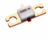
CGH55030F1 Cree/Wolfspeed FET RF 84V 5.8GHZ 440166