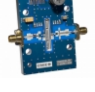
CGH55030F-TB Cree Wolfspeed RF EVAL HEMT AMPLIFIER