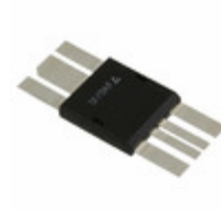
IXRFD631-NRF IXYS RF IC MOSFET DVR RF 30A LOW DCB