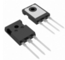
IXRH40N120 IXYS IGBT 1200V 55A 300W TO247AD