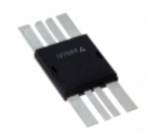
IXRFD615X2 IXYS 15A DUAL MOSFET DRIVER