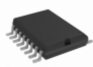
RE46C166SW16F Microchip Technology IC SMOKE DETECT PHOTO MEM 16SOIC