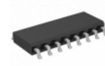
RE46C166S16TF Microchip Technology IC SMOKE DETECT PHOTO MEM 16SOIC