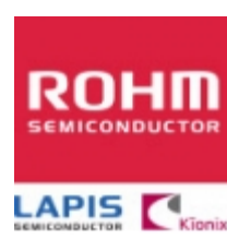
2SAR513P5 ROHM 2SAR513P5 ROHM