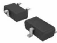
2SAR513RTL Rohm Semiconductor TRANS PNP 50V 1A TSMT3