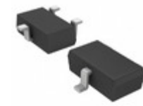
2SAR512RTL Rohm Semiconductor TRANS PNP 30V 2A TSMT3