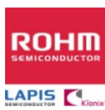
2SAR513PFRA ROHM 2SAR513PFRA ROHM