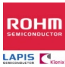
2SAR513P GZE T100 ROHM 2SAR513P GZE T100 ROHM