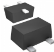
DTC143XUBTL Rohm Semiconductor TRANS PREBIAS NPN 200MW UMT3F