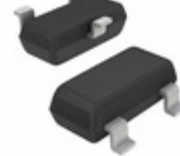
DTC143ZCAHZGT116 LAPIS Semiconductor NPN 100MA 50V DIGITAL TRANSISTOR