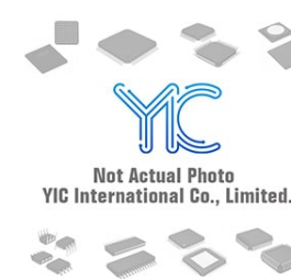
DTC143ZE E23 CJ DTC143ZE E23 CJ