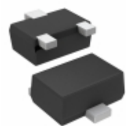
DTC143ZEBHZGTL LAPIS Semiconductor NPN DIGITAL TRANSISTOR (WITH BUI)