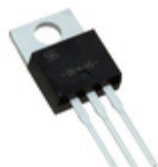
SR1620HC0G TSC (Taiwan Semiconductor) DIODE ARRAY SCHOTTKY 20V TO220AB