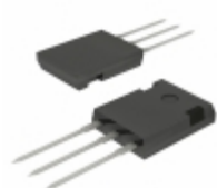
SR16100PTHC0G TSC (Taiwan Semiconductor) DIODE ARRAY SCHOTTKY 100V TO247