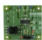
BD6212FP-EVAL-N LAPIS Semiconductor BOARD EVAL FOR BD6212FP