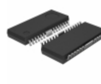
BD6212FP-E2 Rohm Semiconductor IC MOTOR DRIVER PAR 25HSOP