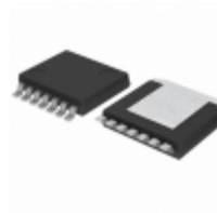
BD6220HFP-TR Rohm Semiconductor IC MOTOR DRIVER PAR HRP7