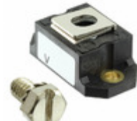
VS-243NQ100PBF Electro-Films (EFI) / Vishay DIODE SCHOTTKY 100V 240A D-67