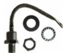
VS-240UR80D Electro-Films (EFI) / Vishay DIODE GEN PURP 800V 320A DO205AB