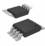
MIC5281YMM-TR Microchip Technology IC REG LDO ADJ 25MA 8MSOP