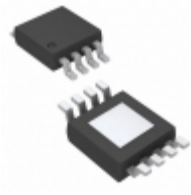
MIC5282-3.3YMME Microchip Technology IC REG LDO 3.3V 50MA 8MSOP