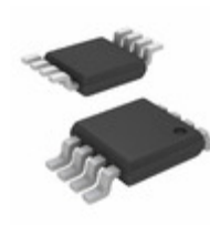
MIC5282-3.3YMM-TR Microchip Technology IC REG LDO 3.3V 50MA 8MSOP