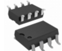
HCPL-3760#300 Broadcom Limited OPTOISOLATOR 3.75KV DARL 8DIPGW