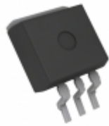
BD733L2FP2-CE2 Rohm Semiconductor IC REG LDO 3.3V 0.2A TO263-3