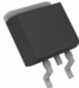
BD733L2FP-CE2 Rohm Semiconductor IC REG LDO 3.3V 0.2A TO252-3