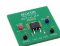
BD733L2FP-EVK-301 LAPIS Semiconductor LDO_EVK_BD7XXL2X BD733L2FP- C