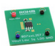
BD733L2EFJ-EVK-301 LAPIS Semiconductor LDO_EVK_BD7XXL2X BD733L2EFJ-C