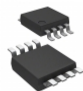
MCP73843-410I/MS Microchip Technology IC CONTROLLER LI-ION 4.1V 8MSOP