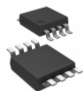
MCP73844-820I/MS Microchip Technology IC CONTROLLER LI-ION 8.2V 8MSOP