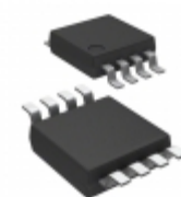
MCP73843-420I/MS Microchip Technology IC CONTROLLER LI-ION 4.2V 8MSOP