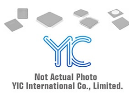
MCP73843-420 Microchip Microchip MSOP