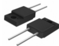
SDURF520 SMC Diode Solutions DIODE GEN PURP 200V ITO220AC