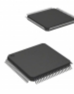
STM32F407VGT6TR STMicroelectronics IC MCU 32BIT 1MB FLASH 100LQFP