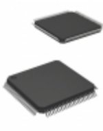
STM32F407VGT7TR STMicroelectronics IC MCU 32BIT 1MB FLASH 100LQFP