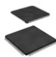
STM32F4071GT7 STMicroelectronics IC MCU 32BIT 1MB FLASH 176LQFP