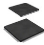
STM32F4071GT6 STMicroelectronics IC MCU 32BIT 1MB FLASH 176LQFP