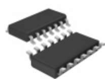
LT6012ACS#TRPBF ADI (Analog Devices, Inc.) IC OPAMP GP 350KHZ RRO 14SO