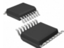
LT6012ACGN#PBF Linear Technology IC OPAMP GP 350KHZ RRO 16SSOP