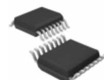
LT6012AIGN#PBF Linear Technology IC OPAMP GP 350KHZ RRO 16SSOP