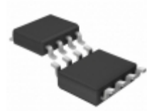
LT6011IS8#TRPBF Linear Technology IC OPAMP GP 350KHZ RRO 8SO