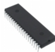
M-986-2R2P IXYS Integrated Circuits Division IC TRANSCEIVER MFC 2CHAN 40- DIP