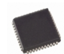
M-986-2A1PL IXYS Integrated Circuits Division IC TRANSCEIVER MF 2CHAN 44- PLCC